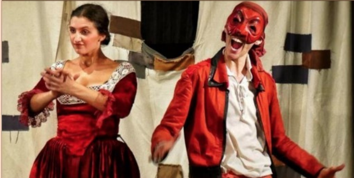
« Le triomphe d'Arlequin » par Amata Compagnie.

« Le triomphe d'Arlequin » de Carlos Boso interprété par Amata Compagnie est tiré de divers canevas de commedia dell'arte, il représente un hymne à la liberté d'aimer dans un monde gouverné par l'égoïsme et les intérêts personnels. L'action se déroule dans une Venise imaginaire où habite un vieil épicier français, Pantalone, qui veut profiter du mariage de sa fille pour s'enrichir. Un capitaine vaniteux va tenter d'enlever la belle Fiordalisse, la fille de l'épicier Pantalone, avec l'aide de l'omniprésent Arlequin. Ce dernier va se révéler être la belle Gelsomina qui, comme Viola dans « La Nuit des Rois » de Shakespeare, s'est déguisée en serviteur par amour. La courtisane Isabella va tomber amoureuse du frère du Capitaine Spaventa, le renommé Capitaine Rodomonte, et pour le suivre elle s'enfuit déguisée en homme... Spectacle vendredi 12 mai à 19 h, à La Cure d'Air Trianon, 74/75 rue Pasteur. Entrée gratuite.