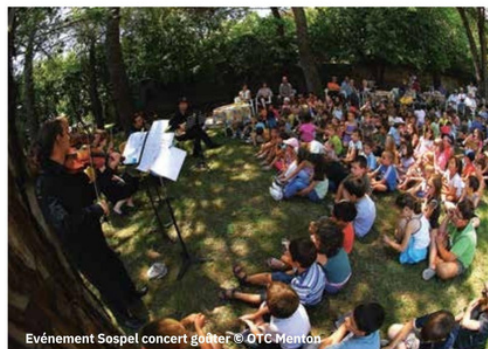
Événement Sospel concert gouter