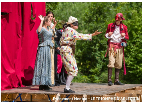
Événement Mentim - LE TRIOMPHE D'ARLEQUIN

L'art baroque alpin est le patrimoine commun du Pays d'art et d'histoire des hautes vallées de Savoie, du Pays du Mont-Blanc, des vallées de la Roya et de la Bévéra, et du littoral dans les Alpes-Maritimes. Nous vous invitons à découvrir les Escapades Baroques en Riviera, dont la programmation constitue un travail minutieux de mise en lumière des sites baroques de notre région.