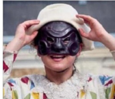
Spettacolo di circo in piazza dei Mercanti

nale, sabato grasso, in piazza dei Mercanti. Ma ci sono altri giorni caldi prima di arrivare alla data clou. Sabato 18 febbraio alle 11 il festival apre alla Fabbrica del Vapore con L'asino d'oro , una storia in cui il protagonista Lucio si trasforma in asino ed è prigioniero dei briganti. Alle 15,30 il divertimento si sposta in Largo San Dionigi Prato-centenario, zona Niguarda, dove arriva Il trionfo di Arlecchino , narrazione ambientata in una Venezia immaginaria in cui si vede un Pantalone intento a utilizzare il matrimonio della propria figlia per arricchirsi. Poi domenica 19 di nuovo teatro all'aperto, con due