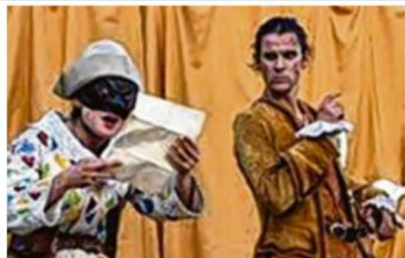
La compagnie AMATA est comme chez elle à la Cour du Barouf.

S.D. A 13h à la Cour du Barouf ; 12/17 €